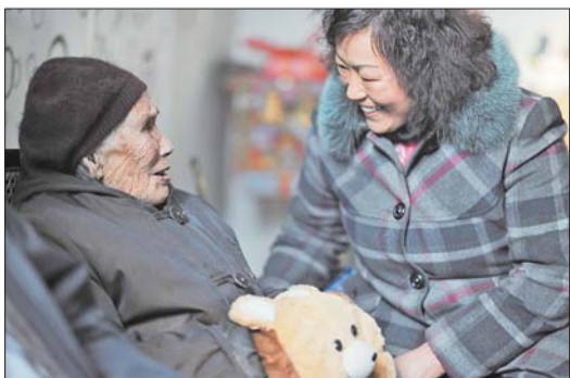
以前岛上的邻居常来串门儿。