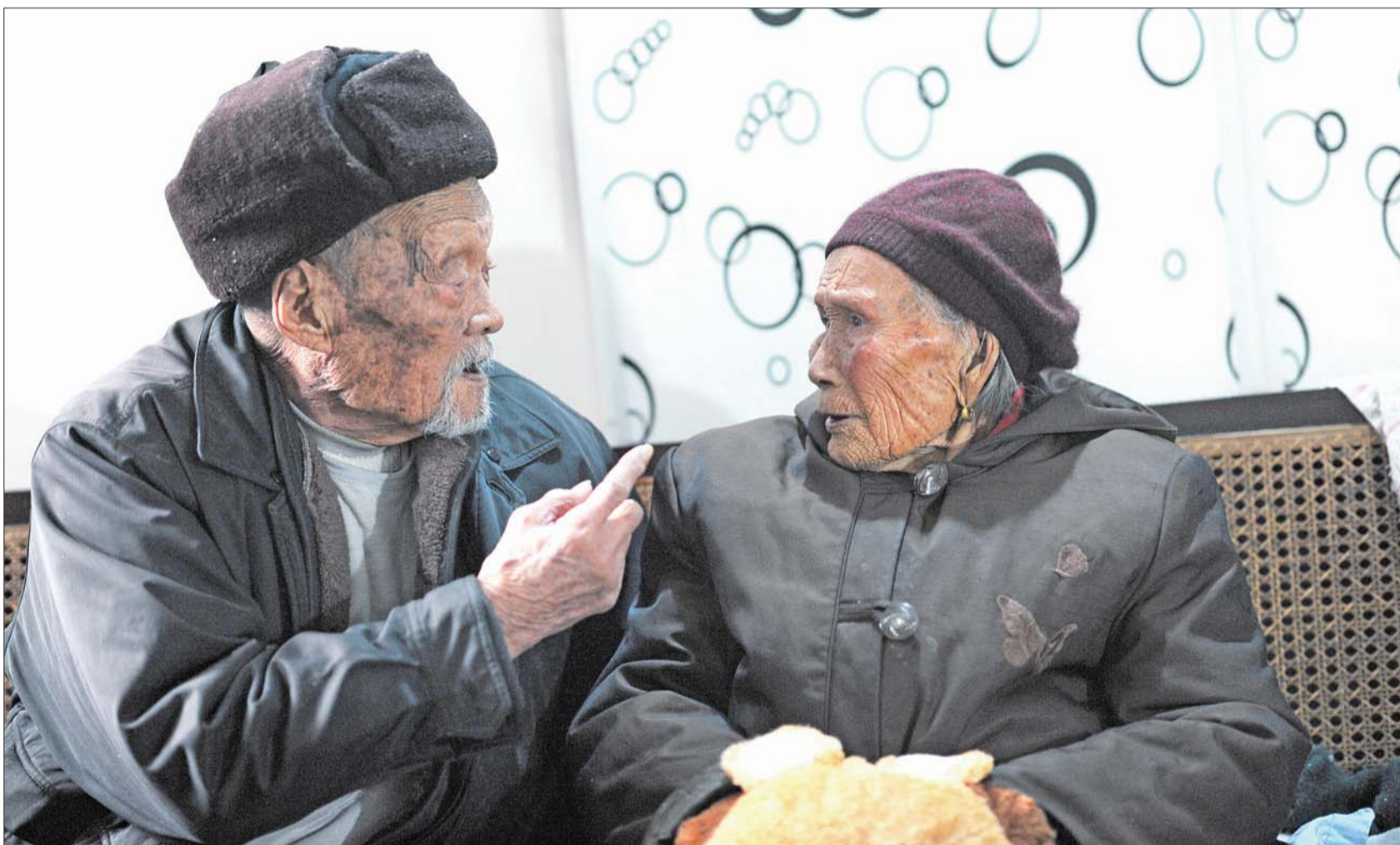
两人常在一起聊早年湖上的生活。