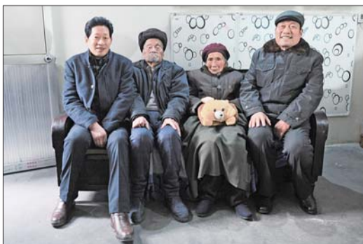
老两口的两个儿子一起来看望老人。