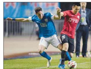
石家庄永昌获得中超第一分。

本报讯 21日晚,中超第三轮开战,贵州人和主场迎战上海申鑫。贵州人和与上海申鑫本赛季可谓“难兄难弟”。中超前两轮赛罢都积零分,结束连败是两队本场的“唯一”目标。