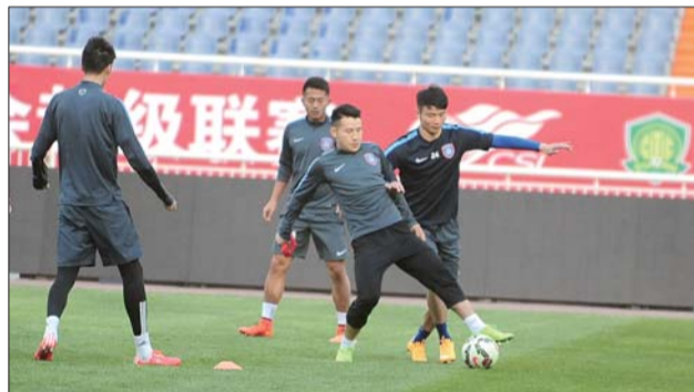
江苏舜天进行赛前训练。

自己还是一团乱麻,恰好乱军中杀出了江苏舜天,恰好对方大将埃雷尔森和孙可还因伤缺阵,鲁能这边则是伤病情况好转,形势此消彼长。到底是杀敌自振,还是继续甘愿堕落?在这个时候,所有人的心里都清楚,鲁能泰山已经输不起了。