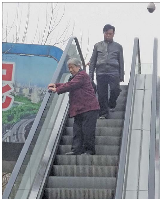
在市中心医院门口,老人小心翼翼地下扶梯。

不少市民建议给电梯加盖棚子,减少室外因素对电梯的影响。该工作人员表示,“这些需要在设计开发电梯时就考虑到,道桥处只是电梯后期运行管理部门。”不过,他也表示担心,“给电梯加棚子,当电梯温度较高时,容易因为散热问题导致主板损坏。”