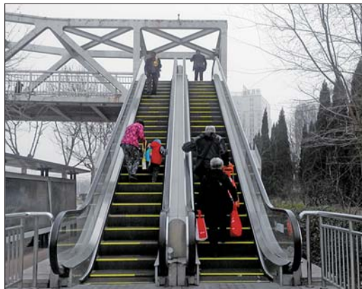
位于名士豪庭门口的电动扶梯停运已久。