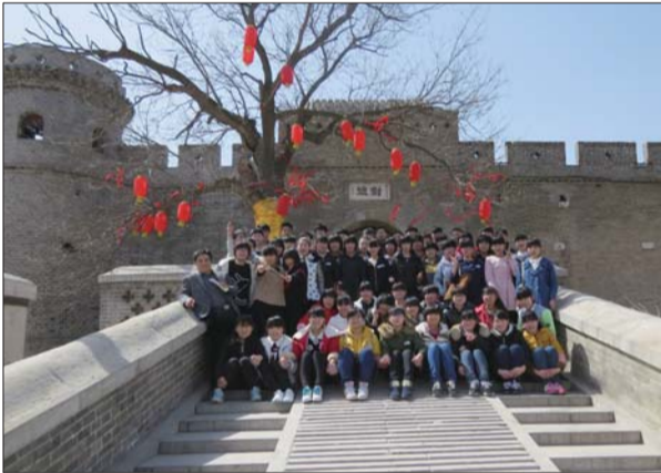
二中高二10班的全体学生和部分学生家长在魏氏庄园合影。

行了精心的策划和准备,制定了科学的活动方案和严谨的事故应急预案,并向学校和教育局进行了逐步审批。学生们参观兴致高昂,秩序井然,在文明参观的同时体现了惠民二中学生良好的精神风貌。 “通过本次活动,不仅是增强了班集体的凝聚力、向心力、服从力、执行力,更重要的是让学生在愉悦身心、增长知识的同时,受到了很好思想的教育,让他们真切感受到先人的聪明智慧,领略到了城堡式民居的文化内涵,激发了他们爱学校、爱家乡、爱祖国的情感。这次活动也必将转化为学生学习的动力。”吴名广说。