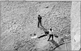
水库水位下降,库底龟裂。

太河水库已20个月无来水,目前库容仅1600万立方米,蓄水量不及去年同期五分之一。太河水库的源头之一拦住湾水库,已接近干枯,即使开闸也已经放不出水。而下游9个村的4016人面临饮水困难。