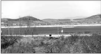
卧虎山水库库底露出不少。

趵突泉、黑虎泉等泉群地下水位震荡下跌,趵突泉面临停喷危险。2014年,济南降水量全市平均430.7毫米,比常年同期635.1毫米少32.1%,比2013年少了4成。今年以来济南市全市累计降水量仅14.7毫米,三个月所有的降水量加在一起只相当于下了一场中雨。