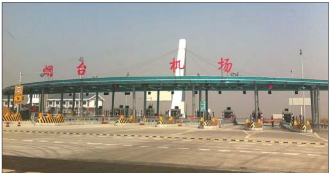
20日，记者驾车到达机场高速出口，目前机场高速已经开通运行。