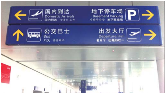
烟台蓬莱国际机场的标识牌上标有中、英、日、韩四种语言。

具体设计充分体现生态节能和人性化。室内车库在两排停车位之间设绿化通风采光带，高大乔木升起起到地面，结合地面植草砖车位，增大绿化覆盖面积；室内停车库可以通往航站楼地下通道及车道边，方便雨天和冬季通行及上下车。