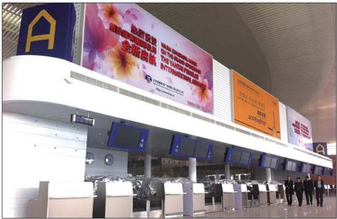
航站楼内部随处可见新机场启用的标语。