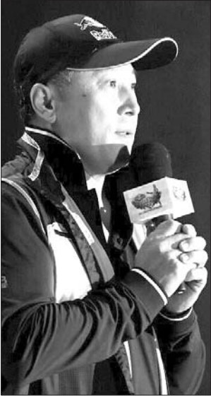
李永波参加了启动仪式。

城市,赛事采取网络招募、任选赛区的“O2O模式”,搭建了覆盖全国的在线组队和报名平台,并针对大众业余体育竞赛的特点,引入全新的“双败淘汰+抽签对阵”赛制,让整个比赛进程更刺激、更富有悬念。比赛将从4月25日正式打响,分为城市赛、大区赛、总决赛三个阶段,7月份决出总冠军。 今年,本报继续参与主办“羽林争霸”红牛城市羽毛球赛鲁中分赛区的比赛,为山东的羽毛球爱好者搭建展示球技的舞台。今年的山东赛区分为鲁中分赛区(济南、临沂、淄博、济宁共4站)和胶东分赛区(青岛、烟台两站),比赛时间为4月25日-5月10日。即日起开始报名,截止至对应城市比赛前10日,欢迎各羽毛球爱好者自由组队或以团体为单位报名参加。鲁中区域赛事统一咨询电话:0531-67871177。