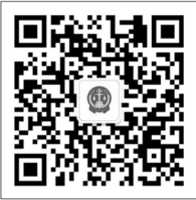
博兴法院微信二维码

警精神面貌的新转变,实现了与群众零距离对接,让社会公众更加了解司法、参与司法、监督司法,为构建开放、动态、透明、便民的阳光司法机制作出了新的努力。 只要通过手机微信扫一扫一下法院微信二维码或者在微信公众账号中搜索“bxxrmfy”或“博兴县人民法院”,手机上马上出现“博兴县人民法院”字样,点击“关注”后,就可以通过微信与法官进行互动。