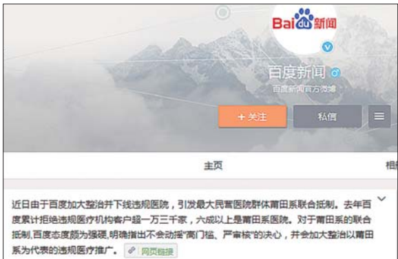
百度给出的强硬回应。

题。26日,百度通过“百度新闻”官微,对莆田系医院的高调抵制作出“强硬”回应,称是由于百度加大整治并下线违规医院,才引发了这次联合抵制。