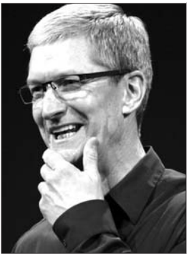
本报见习记者 王晓莹 编译