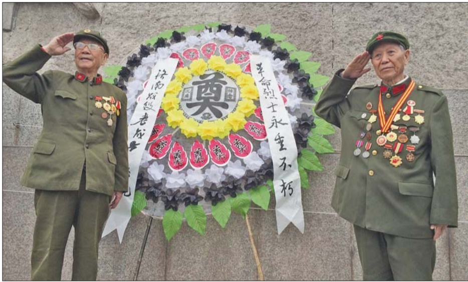
5日上午,参加济南战役的老战士缅怀牺牲的战友。

本报4月5日讯(记者 王杰 见习记者 刘飞跃 实习生 田梓祎 李天琪) 又是一个清明。4月5日,济南英雄山烈士陵园迎来了31位熟悉而又特殊的祭奠者。他们都是当年参加过济南战役的老兵,他们参战时不到二十岁,如今已是耄耋之年,能来参加祭奠仪式的老兵也越来越少了。