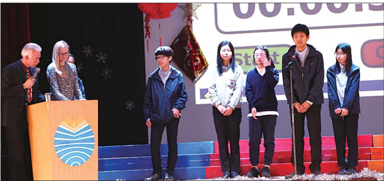
第一届耀华杯拼词大赛现场。

育课程精华的初中课程。比如,在英语学习中,专业外籍教师不仅教授纯正英语,而且用英语来教授学生学科知识,让学生的英语能力得到深层次的提高。 学校的剑桥国际高中及大学预科课程,是学生通往世界顶尖大学的桥梁。学生可以从众多科目中选修适合自己的科目,为日后进入海外名校学习做好全面准备。越来越多的家长意识到,学生最理想的出国年龄是在高中毕业后,在耀华就读国际高中,使学生在语言、文化、学科知识、思维、创造性、自信心、适应性、独立能力等方面都得到极大的提高,学生升入海外大学后,能很自然地融入当地的学习生活以及未来的工作中,成为优秀的世界公民。 此次耀华学校举办英语拼词大赛,目的在于促进烟台地区初中生学习英语的兴