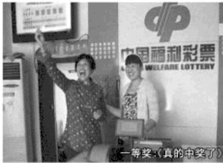
一等奖:(真的中奖了)