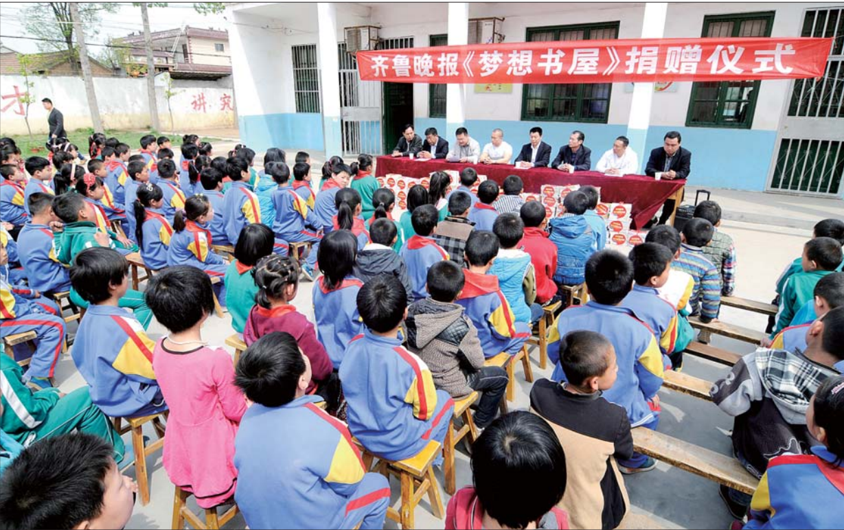
捐赠仪式现场。

本报巨野4月21日讯(记者李德领 实习生 吴鹏) 21日,本报《梦想书屋》捐赠仪式在巨野县太平镇白李小学举行,1000册课外书给学生们带去知识的甘露,也充实了他们的课余生活,这是本报联合爱心单位恒动健身俱乐部送给学生们一生的礼物,也是本报捐建的第15座梦想书屋。 在白李小学,当工作人员将书从车上搬下时,学生们好奇地围上来,一个个流露出羡慕的目光。当得知这成捆且崭新的课外书以后就放在图书室供他们借阅时,学生们都迫不及待地打开,一睹为快。