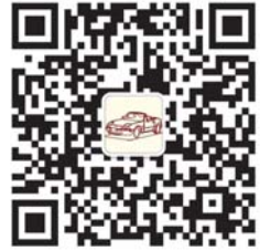
齐鲁晚报今日菏泽 菏泽车友会官方微信二维码