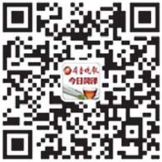
齐鲁晚报今日菏泽 官方微信二维码

多的营养。 “1000册课外书带给孩子们的不仅仅是课外书上的知识,更能帮助孩子们了解外面世界。”何金珪说,以后还要用自己的力量做更多公益。 (本报记者 李德领)