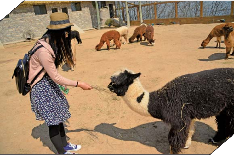
在跑马岭野生动物世界,游客可以近距离喂食动物。

“五一”期间,景区还将组织一系列活动。针对园内盛开的槐花,景区还将组织槐花节活动,游客可以自己动手,利用刚刚采摘的新鲜槐花,制作槐花饼、品尝槐花蜜、马戏馆每天都将带来精彩表演,小孩骑车、狗熊跳绳、老虎跳远等动物杂技表演纷纷亮相,将为游客带来无尽的欢声笑语。