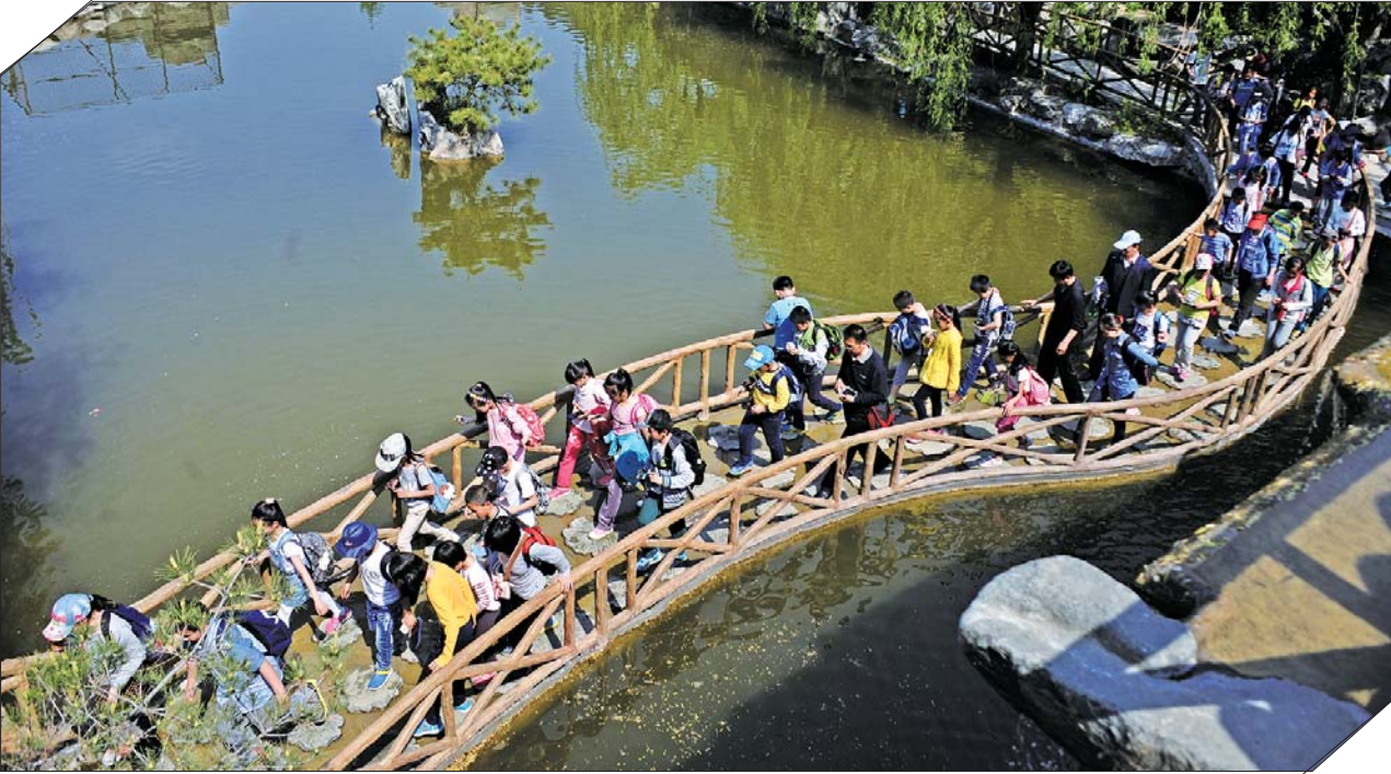
九顶塔狂欢节上游客如织。南部山区景区人气爆棚,人们享受泉城短暂而美好的春天。

4月30日到5月2日期间,水帘峡还将推出大型民族表演,组织篝火晚会,免费观看5D电影。