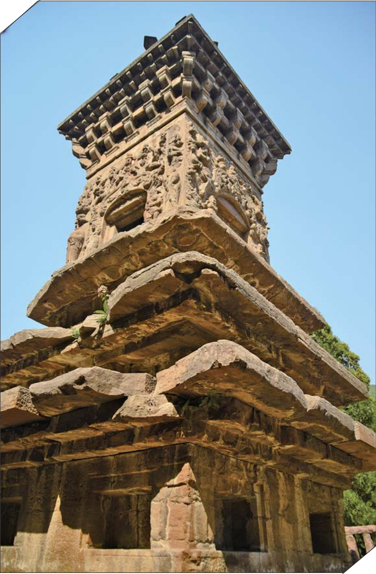
四门塔景区内的龙虎塔。