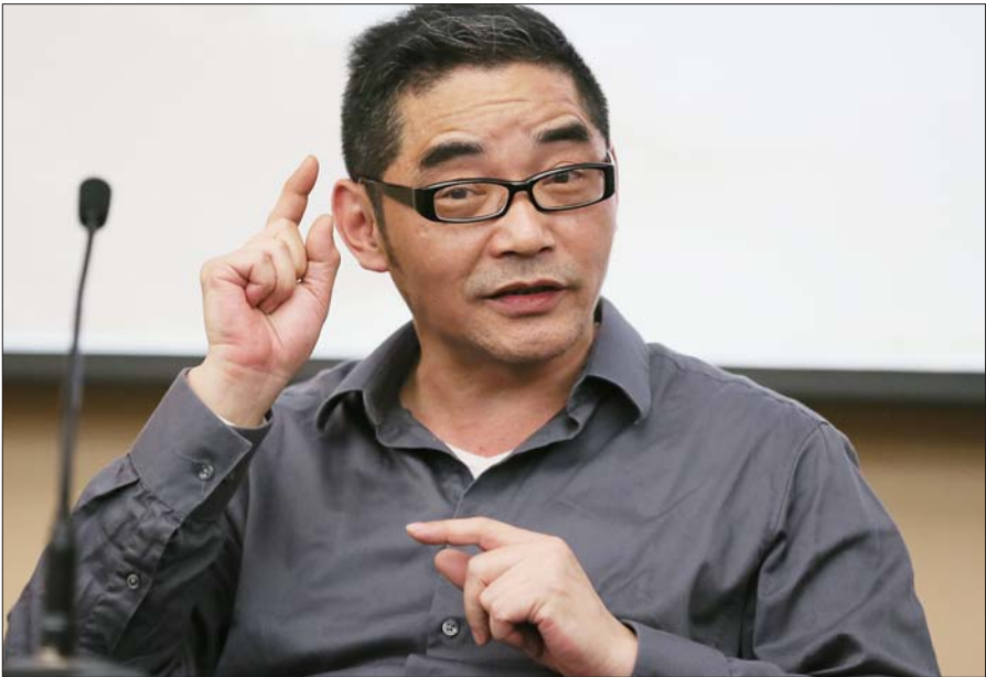
苏童在讲座中。

1980年,苏童成为北京师范大学中文系的一名学生,时隔35年后,谈到如何做教授、做老师,苏童称,他比较反感动不动就以过来人的身份教