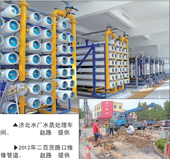
▲济北水厂水质处理车间。

阶梯水价制度,仍然按照济阳价格发【2009】20号文件进行收费。 文件规定城市居民生活用水到户价格为2.18元/立方米,其中基本水价为1.23元/立方米,水资源费0.25元/立方米,污水处理费0.70元/立方米。工业、经营服务及办公用水价格为2.76元/立方米,其中基本水价为1.71元/立方米,水资源费0.25元/立方米,污水处理费0.80元/立方米。 据了解,济阳稍门平原水库建成后,出厂水价将达到1.65元/立方米,加之管道漏损成本价将达2元/立方米。(不包括自来水公司本身的运营成本以及污水处理费、水资源费,三者成本预计达2元。)