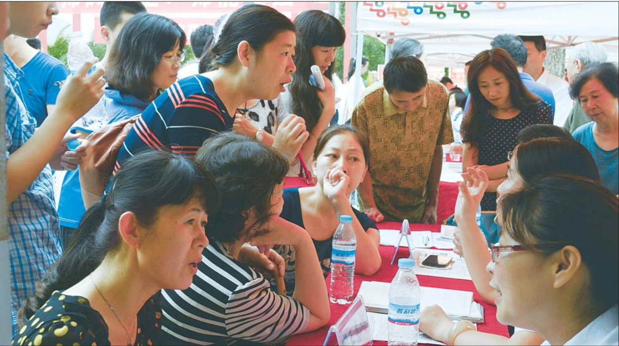
▲学生和家長在諮詢中考招生政策。(資料片)

中考在即,今年高中阶段学校招生志愿填报有什么变化?4日,从济南市教育局中小学招生工作会议上获悉,今年济南市中考填报志愿将首次实行“平行志愿”,即第二次志愿填报时,每个考生可以填报三个普通高中志愿,学校之间可以兼报。录取时将按“分数优先、遵循志愿”的原则进行志愿检索。