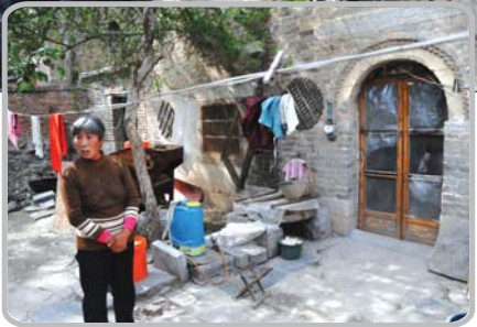
▲其中一座小楼至今仍有人居住。

4日下午，嘉祥县旅游文物局文物科的工作人员也赶到了现场。文物科相关负责人介绍，2008年全国文物普查时，这两座楼房他们已做登记。“根据建筑风格判断，楼房应该是清末或民国初年的建筑，没被列为任何一级文物保护单位。”该负责人称，根据《文物法》相关规定，楼房归个人