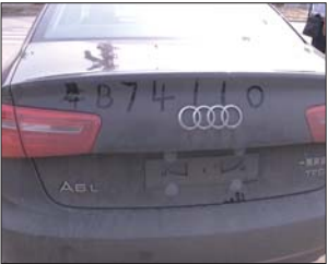
车尾部手写的号牌。

“这不是我写的，我不知道是谁写的，这是老板刚买不久的新车。”面对民警的询问，该车驾驶员称自己对于车后的几个字一无所知，是老板临时让自己开车去办事。随后，民警对该驾驶员进行了批评教育，并责令其立即将车尾的字样擦除。因没有悬挂临时号牌，民警对该车进行了暂扣。