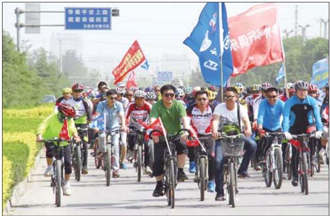
千人骑行倡导绿色出游。