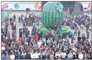
品瓜大会吸引了众多市民围观。