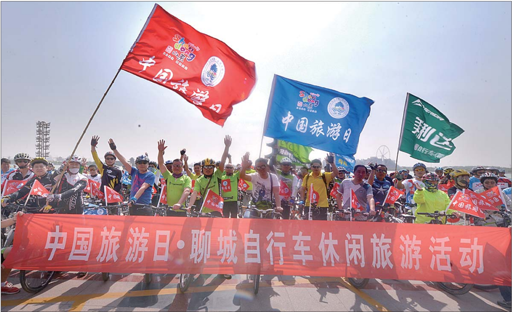
千人骑行聚焦全城目光。