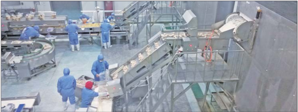
新和盛现代化食品生产线

从早些年非典到近几年的速生鸡、禽流感,家禽养殖业一直在跌宕起伏的食安事件中踽踽独行,一连串的事件打击也让消费者对禽肉安全充满了不信任。而来自潍坊的新和盛农牧集团有限公司却凭借“赔钱”给养殖户的办法,牢牢从养殖源头筑起质量藩篱,不但从历次行业危机中生存下来,而且越做越大,用过硬的品质重新赢回来市场。