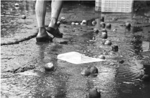
雨中腐烂的桃子。

25日上午10时许,济宁市水果批发市场内,不见往日熙熙攘攘,车来车往的热闹景象,冒雨前来批发瓜果的小贩寥寥无几。雨还在下,孙师傅用塑料布盖住果筐,掩不住的干脆裸放在外面,一筐筐泛红的鲜桃,被雨水淋着。地上,散落着腐烂的桃子。“一上午就卖了一批果子,给他装满了一三轮车,得有700多斤,只