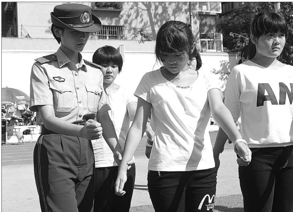
9月6日,在山师附中军训中,“90后”女兵成为教官,“90后”训练“00后”。