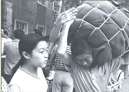
1999年,山东师大新生报到。