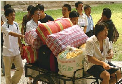
2005年山东大学一名新生报到。