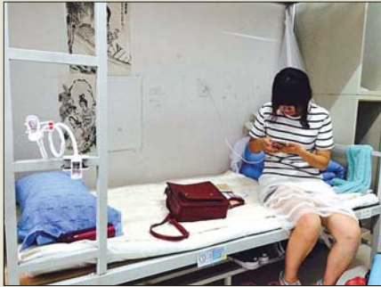
2015级新生的行囊,iPad、手机支架齐上阵。

“那时候买个运动裤都没啥牌子,毕业了大家才有穿阿迪的。”李强说,网吧基本是他们快毕业时候才出现的,偶尔能看看电视就是莫大的精神享受,娱乐生活的匮乏让大家把劲头都用在了学习上。