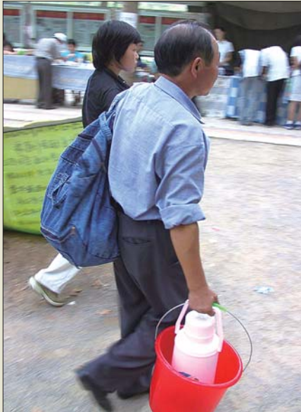
2001年,山东大学一名新生在家陪伴下报到。