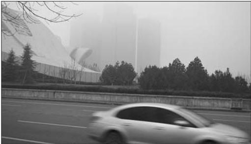
百米内高楼淹没在大雾中。

未来三天具体天气预报为,11月30日夜间到12月1日,阴有小雨,有雾,南风转北风3-4级,最低气温1℃左右。2日,阴转多云,北风4-5级阵风7级,最低气温1℃左右。3日,多云转晴,北风4-5级,最低气温-2℃左右。