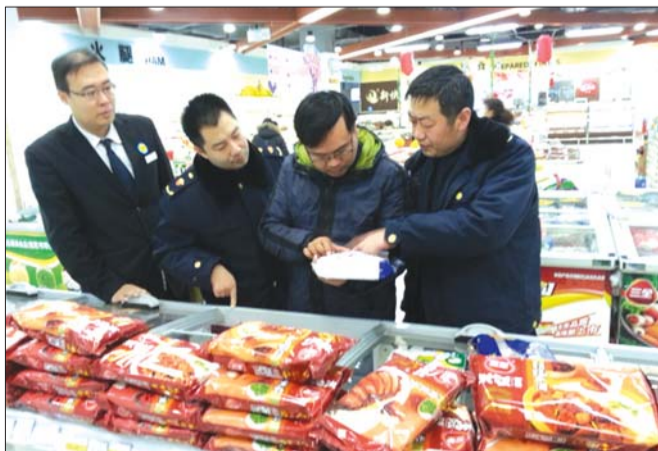
市场监管人员在抽检羊肉制品。