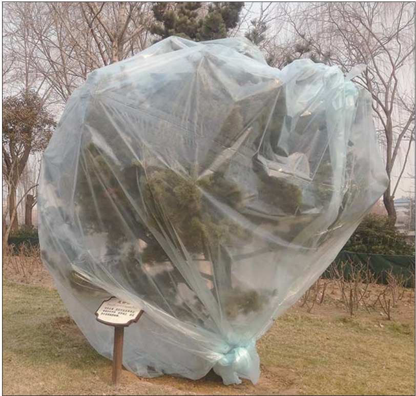
寒潮来临前,各种植物“穿衣戴帽”御寒。