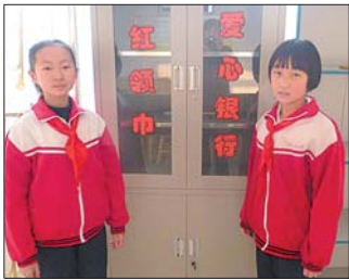
学生和他们的爱心银行。

随着教育现代化、国际化、多元化的不断推进,章丘教体局搭建多元育人平台,建设开放课程体系,构建自由发展空间,打造精致班级、建设精美校园、实施精准教育,把学习变成生活,让校园成为家园,让校校有特色、班班有特点、人人有特长,凸显章丘特色现代教育。