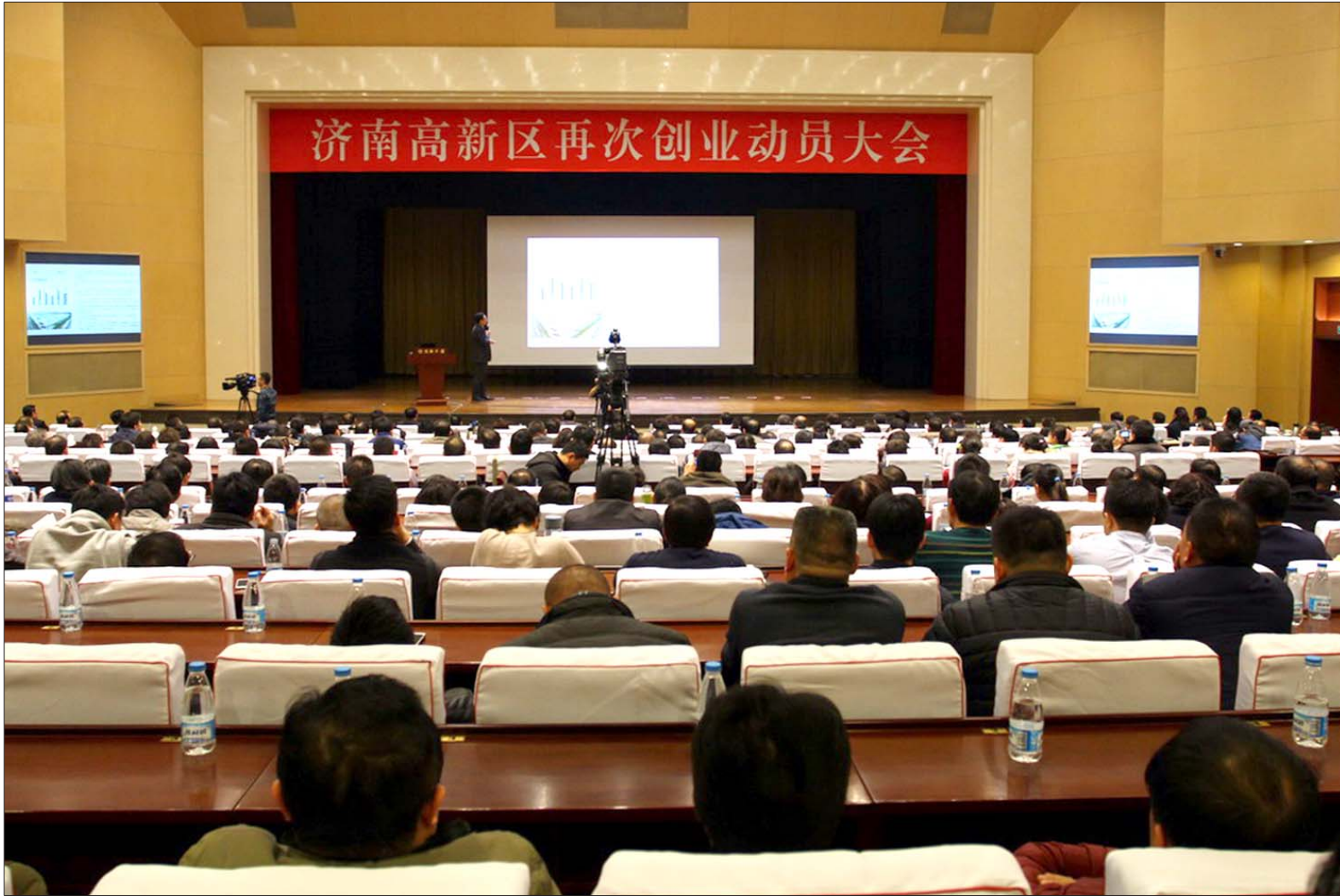
高新区召开再次创业动员大会。

此外,高新区还将发挥综合保税区政策优势,加快发展保税物流,出口加工、跨境电子商务等主导产业,使之成为全市区域物流中心建设的新阵地。