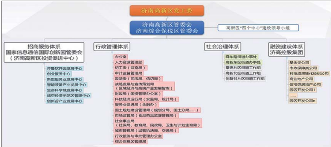
高新区体制机制改革后的管理体系