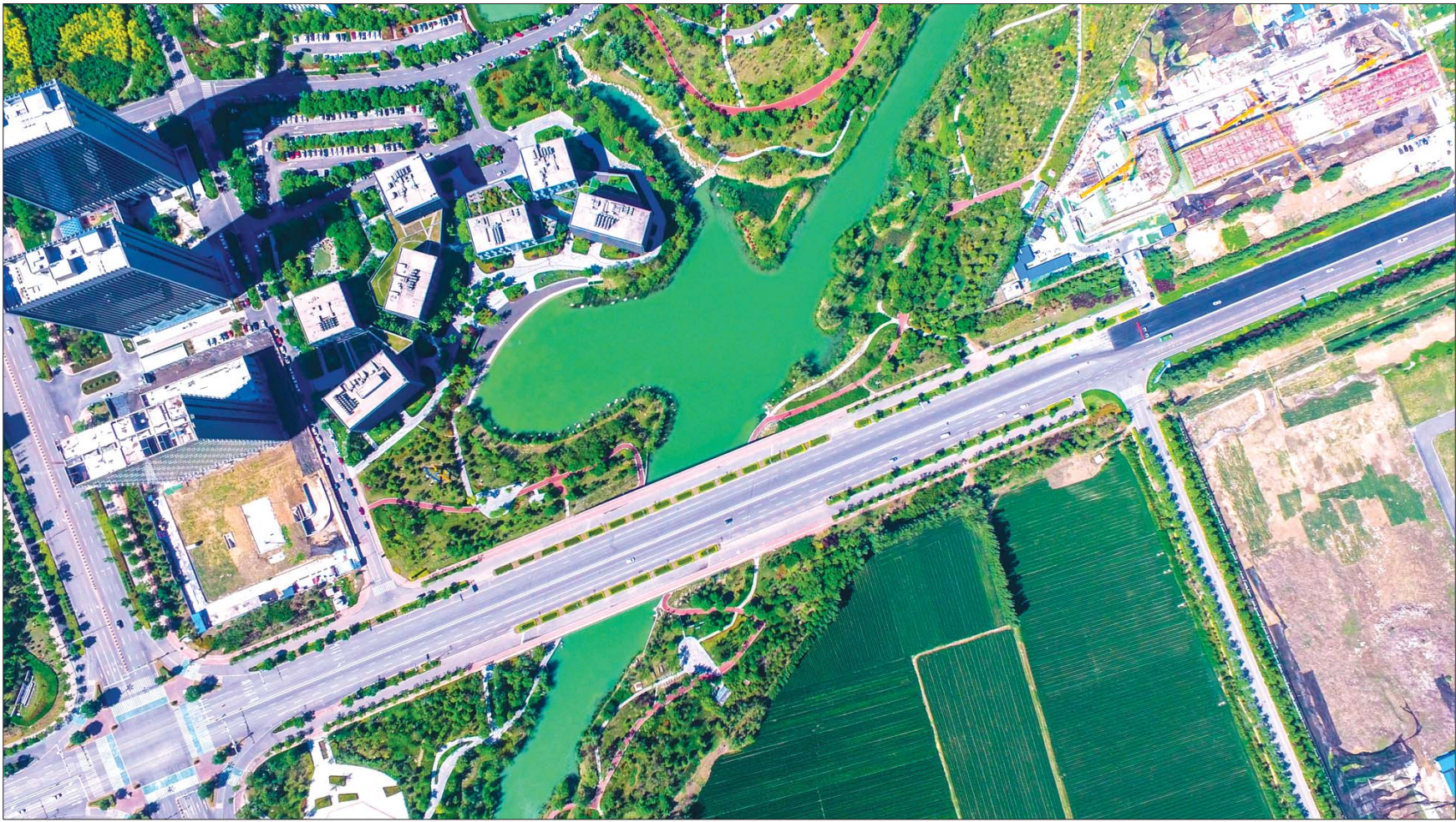
航拍下的产学研基地。