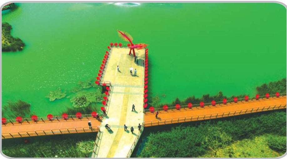
碧波荡漾,蓼河湿地公园。