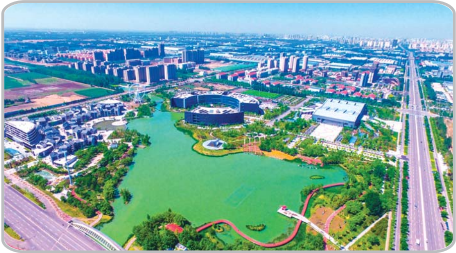
航拍下的济宁科技中心。

有现代时尚感的建筑,搭配蓝天白云、葱郁的绿草地,一眼望去,心情顿时舒畅了很多。 当夜幕降临,华灯初上,云集祖国南北创客的产学研基地灯火通明,他们正挥洒着青春,用激情点燃梦想。 新世纪广场、金宇路商圈,悠闲逛街的行人,或三五结伴,与好友、与朋友、与家人,共度这初夏的美丽夜晚。 初夏的季节,怀有梦想,让我们相聚济宁高新区,一座魅力四射的科技新城。