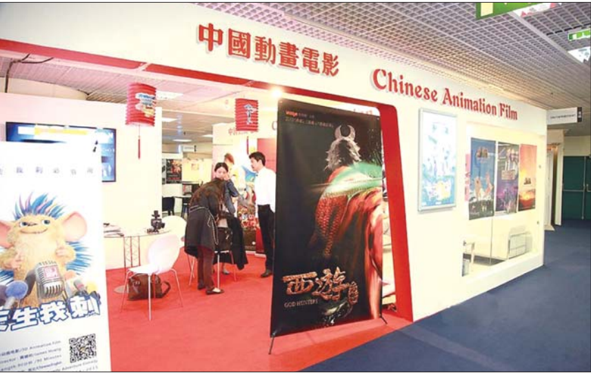
中国多部电影亮相电影宫。