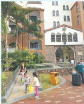
午后孩子们在老人的陪伴下玩耍