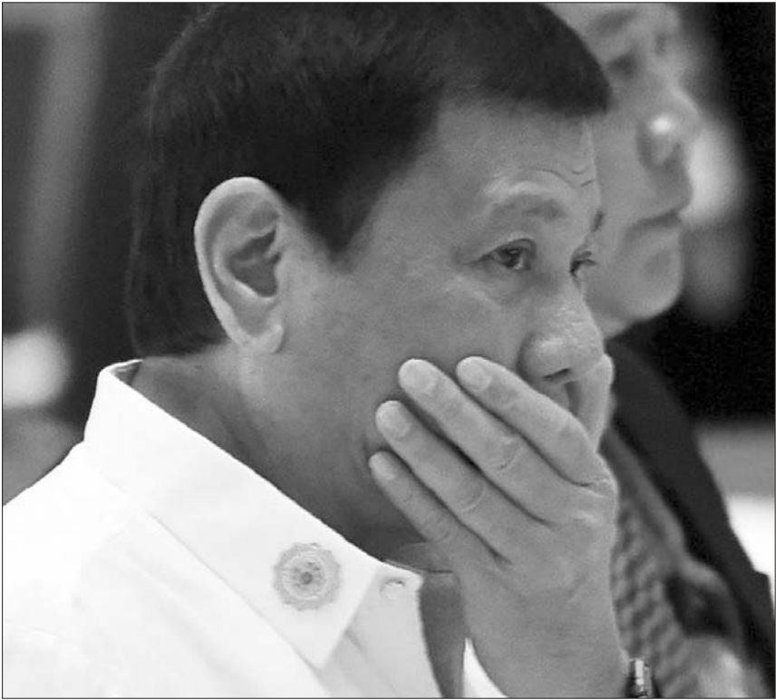
当地时间9月6日,老挝万象,菲律宾总统杜特尔特出席东盟峰会。