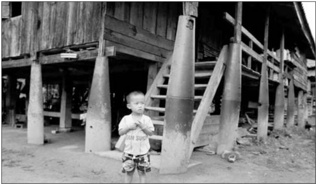
9月3日,老挝沙湾拿吉省,一个男孩站在一栋用越战期间美军投掷的炸弹支撑建造的房子前。