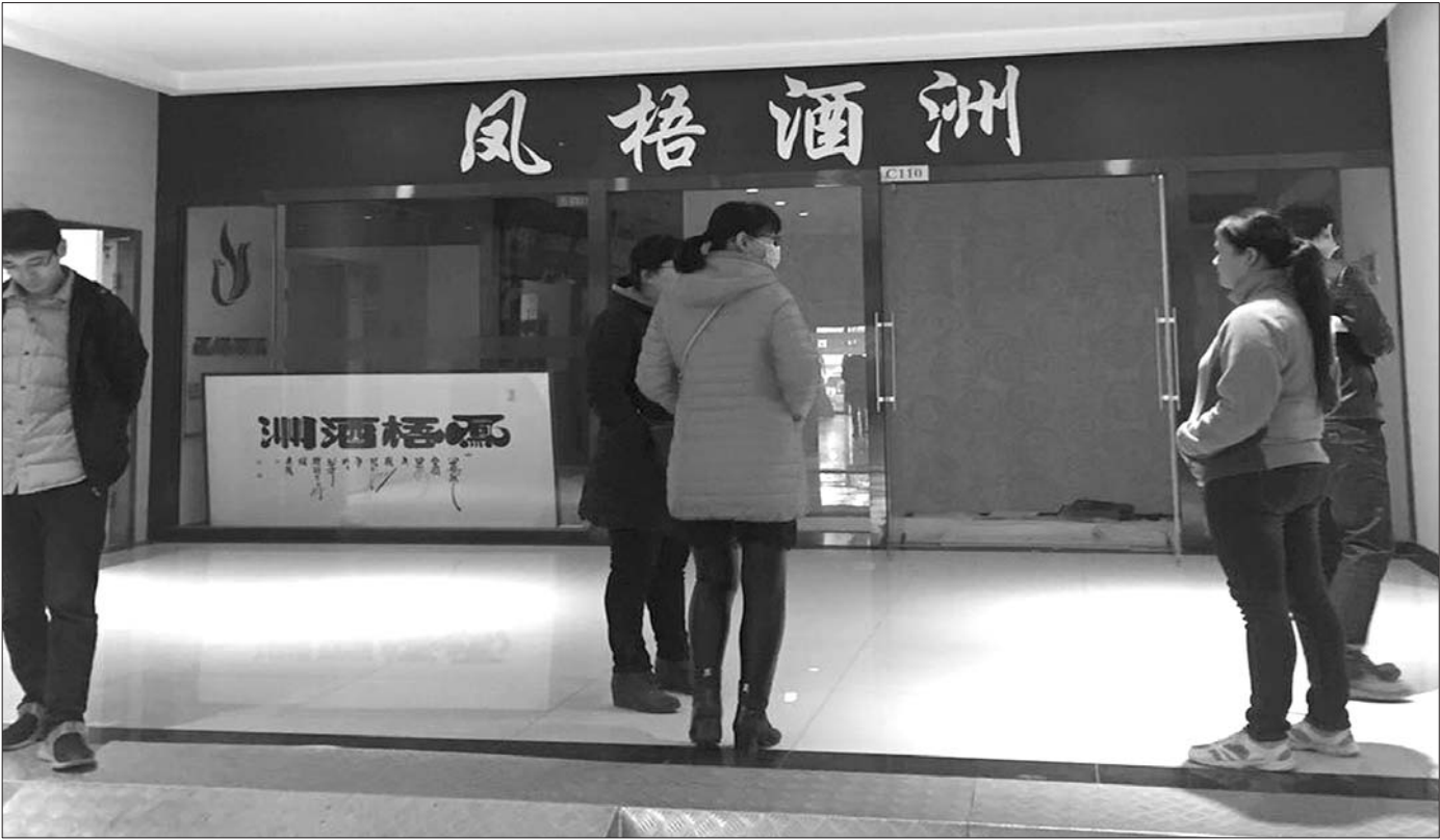
不少投资者回到凤梧酒洲讨要说法，但已经晚了，就连店里的家具也早被其他投资者拿回了家。

2015年10月25日，山东凤梧酒洲电子商务交易平台在济南风风火火地拉开序幕，该公司自称全国首家从事白酒现货交易的公司。然而仅上线一年，该白酒现货交易平台就出现了资金问题，全国数百名会员无法兑现账户里的资金，涉案金额在三千万元。11月4日，记者在该公司了解到，公司在一周前就开始关门了，店里的货物也被前来讨要资金的会员哄抢一空。