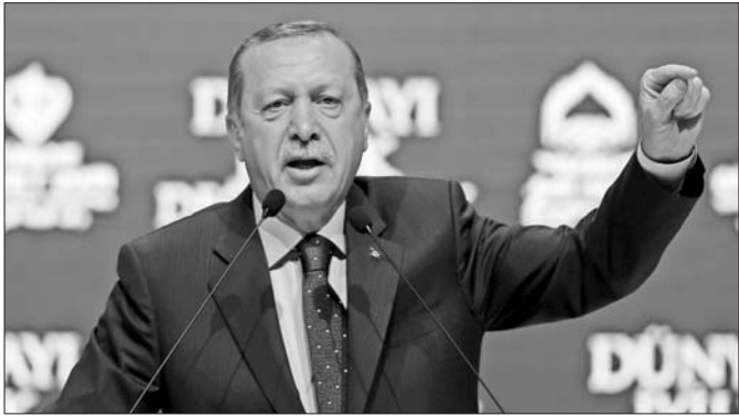
土耳其总统埃尔多安

德国对土耳其的态度也变得更强硬。德国内政部长德迈齐埃12日说,强烈反对土耳其部长在德境内举办政治集会,表示可通过法律途径阻止。德国财政部长朔尔茨认为,土耳其“破坏了进一步合作的