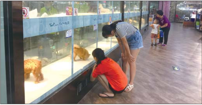
宠物越来越受年轻人的喜爱。

根据《2016年度中国宠物行业白皮书》显示,约4成的主人每月为宠物花费300至400元,近3成的人为宠物花费400元以上。近年,宠物服务市场不断细分完善,训练、摄影、托运、养宠咨询、保险、殡葬等业务广受资本关注,蕴含着无限商机。