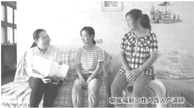
聊城福彩工作人员入户调研

据了解,2017年由聊城市福彩中心、聊城日报联合举办的“2017福彩爱心助学行”活动共收到报名表近百份,此次活动报名学生覆盖8县(市、区)和城区,入户调查工作量非常大。为早日完成调查,连日来,聊城市福彩中心工作人员马不停蹄,一直在路上奔波。报名学生家庭所