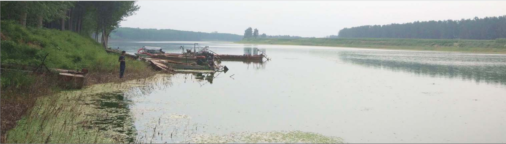
徒骇河部分河面较宽,具备通航的基础。