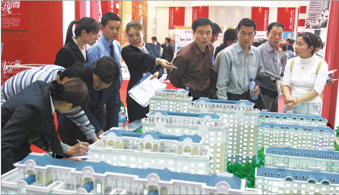
每届展会成购房者看房首选之地。

据展会主办方介绍,本届房展会招商之初就引来了众多开发商的关注,除了历届房展会的“常客”之外,其中不乏“新人”面孔。如今,近20余家一线品牌开发商,携手30余个楼盘项目“抢得”展会展位,与省城购房者见面。 其中三个黄金VIP展位被万科、中海和龙湖三家摘得,它们将携手各自旗下项目多盘联动,届时将成为本届展会的一大亮点。值得关注的是,刚刚进入济南后的首创地产,也首次亮相房展会。除此之外,恒大、绿地、鲁能、融创、中建、海信、鑫苑、西城、万虹等品牌房企也将带来各自的品质项目,汇集多物业形态,为泉城市民带来一场精彩的购房盛宴。