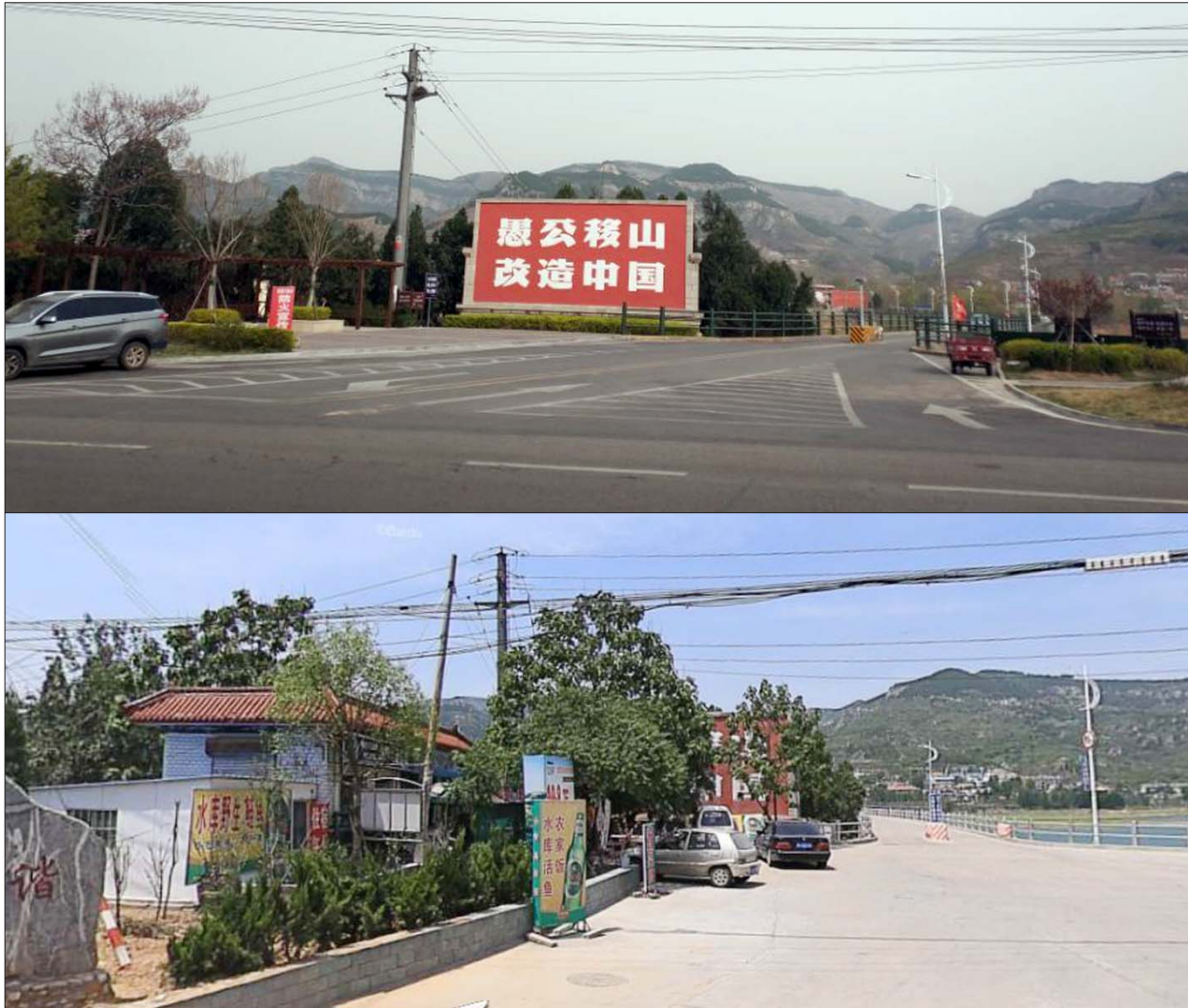
锦绣川水库旁,一块愚公移山的牌匾立在路边(上图)。此前,这块牌匾前开了一家农家乐,将牌匾挡住了大半(下图)。

但是承租下来后,山东省微山湖鱼馆有限公司却失约了,把这里建设成了用于出售的商品别墅。2017年5月25日,锦绣川办事处组织执法队员500余人,动用拆除机械8台,对“微山湖”别墅群进行依法拆除行动。