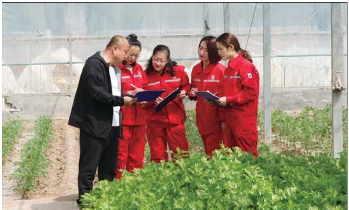
员工记录农作物生长数据。

此外,盐化公司不忘初心使命,担当作为,主动为油田盘活人力资源、挖掘资源效益做贡献,及时清退外雇用工,腾出空间安置了孤东采油厂12名主业职工。2018年随着两个项目的扩产,公司表示将会接纳更多油气主业的富余职工。