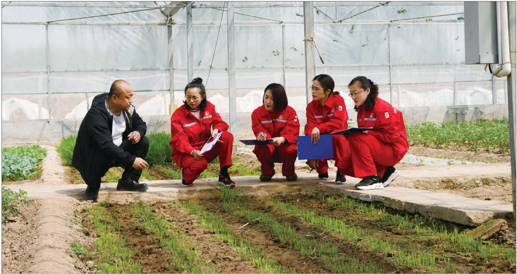
专家给新入职员工传授农业生产技术。

“融入区域经济借势借力、聚焦价值创造转型发展”,曾经以管护土地为主的胜利油田金润农业公司,如今靠深耕细作将现有土地资源经营成效益增长点。争取政府支持种植经济苗木、临海农用地发展生态养殖、盐化工产业拓展高附加值产品、闲置房屋资产盘活再利用……一系列措施使金润农业由“管理土地”向“经营土地”转变,确保了国有土地的保值增值和经济效益的持续稳定增长。数据显示,近三年该公司经营收入和净利润均呈直线上升态势,其中2017年实现收入5745万元,净利润1017万元。