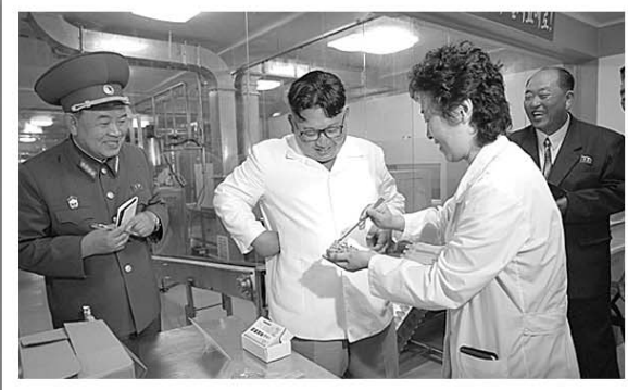
7月25日,金正恩视察朝鲜人民军第525号工厂。