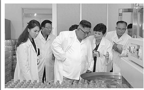
7月26日,金正恩与夫人李雪主视察松涛园综合食品厂。