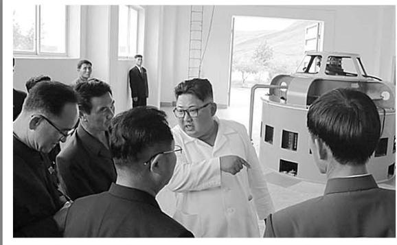
7月17日,金正恩视察渔郎川发电站建设工地。