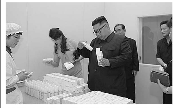
7月2日,金正恩与夫人李雪主视察新义州化妆品厂。