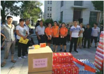
平安保险第一时间将救灾物资送到需要的地方。