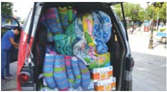
华夏保险把被褥等生活用品送到最需要的地方。