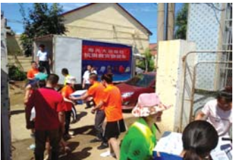
寿光大地保险运送救灾物资。