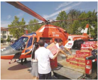
山东人保财险直升机义务救援，关键时刻展现企业担当。