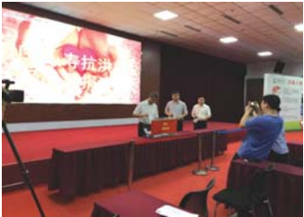
中国人寿积极为灾区募集救灾款。