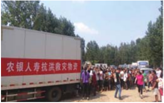
农银人寿为受灾群众分发救灾物资。