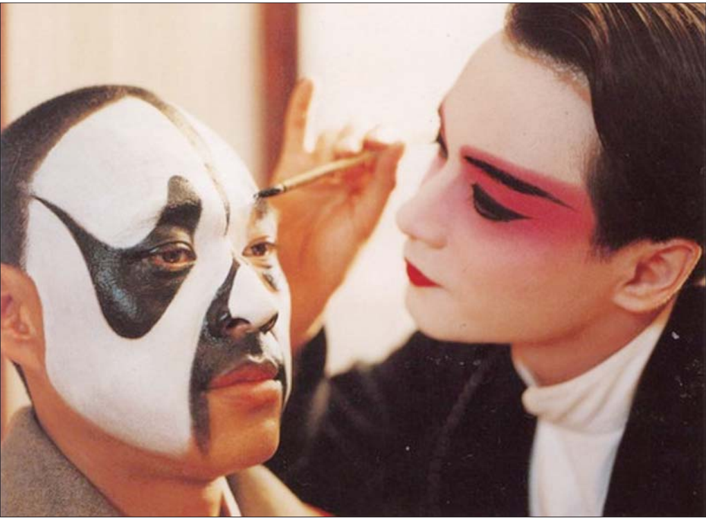
电影《霸王别姬》呈现了人的复杂性和多面性。

1993年的大众文化百花齐放，流行一时的音乐与能够成为经典的影视文学作品以爆发的姿态出现。这一年，《涛声依旧》《牵挂你的人是我》《小芳》《笑脸》等流行歌曲唱遍大街小巷，这几乎是流行音乐多年来难得一见的高峰之年。1993年也是中国电影的大年，陈凯歌的《霸王别姬》与谢飞的《香魂女》扬名国际电影节，成为名留影史的经典；这一年，开创中国情景喜剧先河的《我爱我家》播出了前40集；文学作品方面，在中国当代文学史上影响深远的《白鹿原》在这一年首次出版。