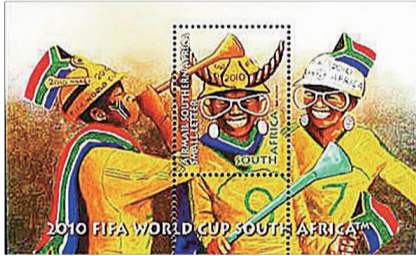
▲南非发行的世界杯邮票