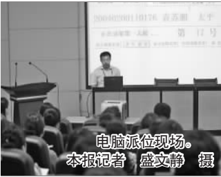
电脑派位现场。

“老师,你们混编的速度有些快,孩子的名字看不清,能不能慢一些?”在派位现场,509名学生的信息出现在大屏幕上,程序进入混编阶段,一位老先生提出问题。应老人的要求,混编的速度开始放慢。最终,