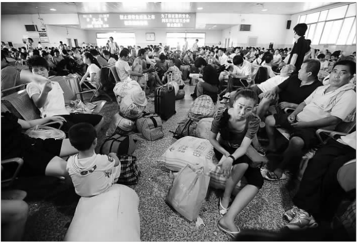
7月1日,济南火车站,大批旅客等候在候车室。由于暴雨中断京九线,导致火车晚点。

1日下午,记者从菏泽市火车站了解到,该站自1日0时至10时封停了列车开行,当日有数个班次列车受到影响延迟发车,其中延迟发车最长的是菏泽发往烟台的5020次列