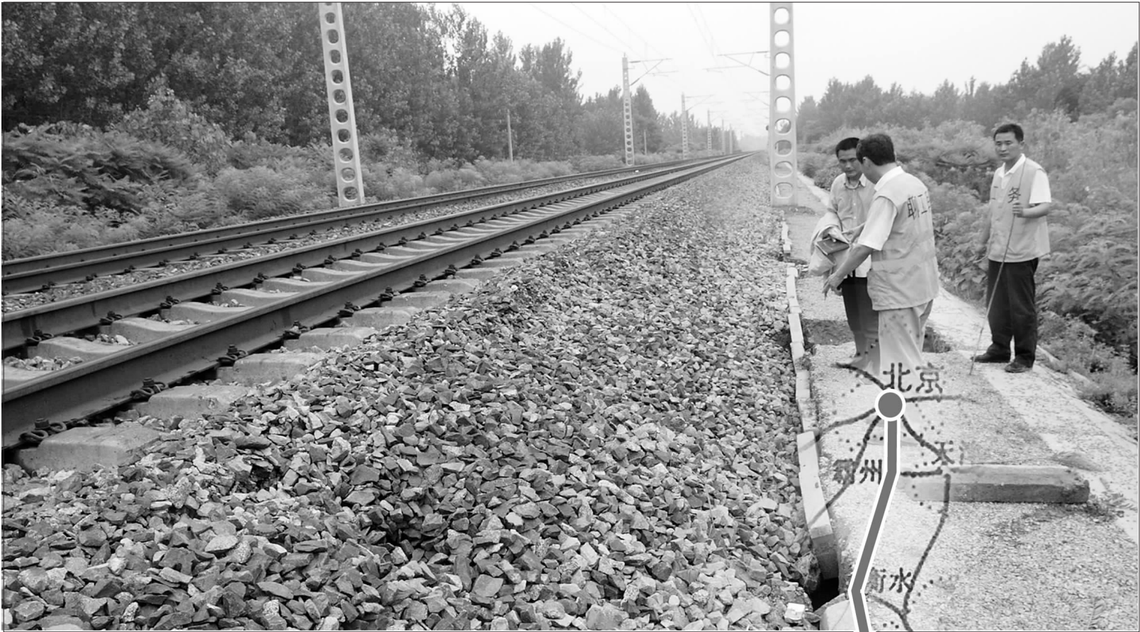
1日上午,曹县普连集段,铁路工作人员正在检查抢修路面。