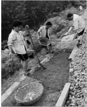
1日上午,曹县普连集段,铁路工作人员抢修铁路边坡。

2日夜間到3日白天,降雨基本结束,气温不断回升。鲁东南和半岛地区天气阴有小雨转多云,其他地区天气多云。最高气温:内陆地区30℃左右,沿海地区25℃左右。