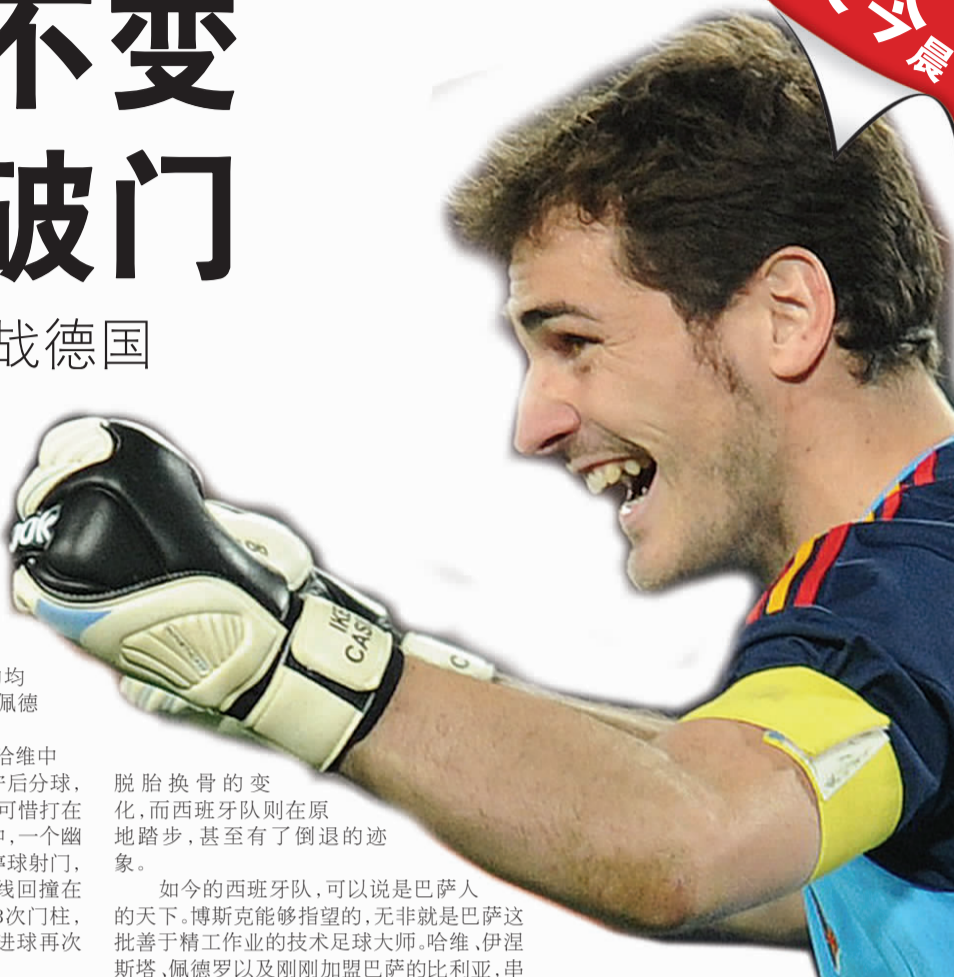
► 卡西利亚斯欢呼胜利。 ▼ 比利亚打入制胜球瞬间。