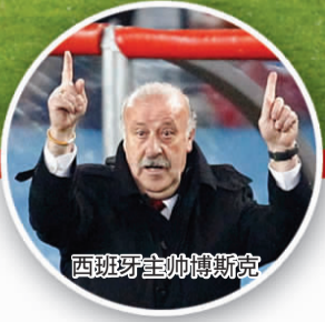
西班牙主帅博斯克

强,这是西班牙足球最辉煌的时刻。一切都如此完美。”不过,在比利亚完成绝杀的那一刻,西班牙队替补席上一片沸腾,唯独博斯克一个人面无表情地转过头去,这位老师的冷静和淡定令人折服。在胜利之余他仍不忘敲打弟子们,“我们踢得不错,也创造了很多机会,但控球还没有达到应有的水平,比