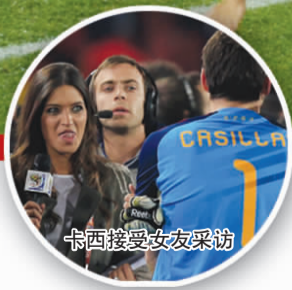
卡西接受女友采访