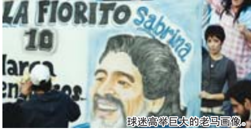
球迷高举巨大的老马画像。

成千上万身着蓝色阿根廷队服的球迷，聚集在机场的高速公路以及阿根廷足协总部周围，许多球