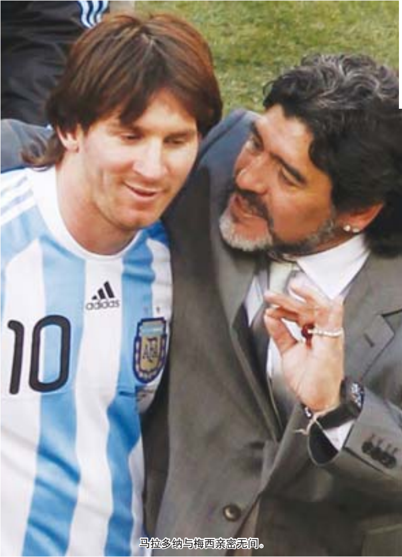
马拉多纳与梅西亲密无间。

已两次与公牛队面谈的韦德表示，他准备利用这个周末深思熟虑一番，计划下周二拿定主意。斯塔德迈尔目前已来到纽约，打算与前主帅德安东尼再度联手，可尼克斯队现在不想马上接纳他，因为他们的首选还是詹姆斯、韦德和波什中的任何一位或两位。