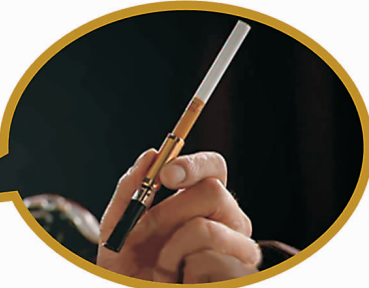
潇洒使用法国Ziiber黄金烟嘴

由法国Ziiber研发中心巨资研发的黄金烟嘴畅销世界各地,独有的七层超强过滤和净化技术,外形美观大方,显示高贵的身份和健康意识。已成为尊重妻子、关爱健康、对家庭负责,珍惜生命的一种表现。