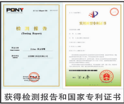
获得检测报告和国家专利证书

就奖。国际健康组织还呼吁广大烟民应尽早使用Ziiber黄金烟嘴,以减轻烟毒对身体的损害。早一天使用,早一天受益。