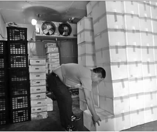
瓜果市场上的冷库只能用来存放苹果、梨等水果,甜瓜等时令性水果不宜用这种方式储存。